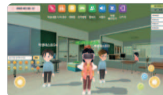
사이버스 속 공간 예시

각 스테이지별 약 10분 이 소요되며, 모든 스테이지는 개별적 으로 운영되기 때문에 수업 상황에 맞춰 선택하여 활동 하면 됩니다.