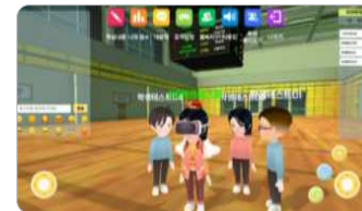
사이버스 속 공간 예시

메타버스 교구 사이버스는 사이버폭력 예방교육 프로그램 입니다. 학생들이 메타버스 속 아바타 로 활동하며 총 8가지 스테이지 미션 수행 을 통해 8가지 사이버폭력 예방 역량*을 기를 수 있습니다.